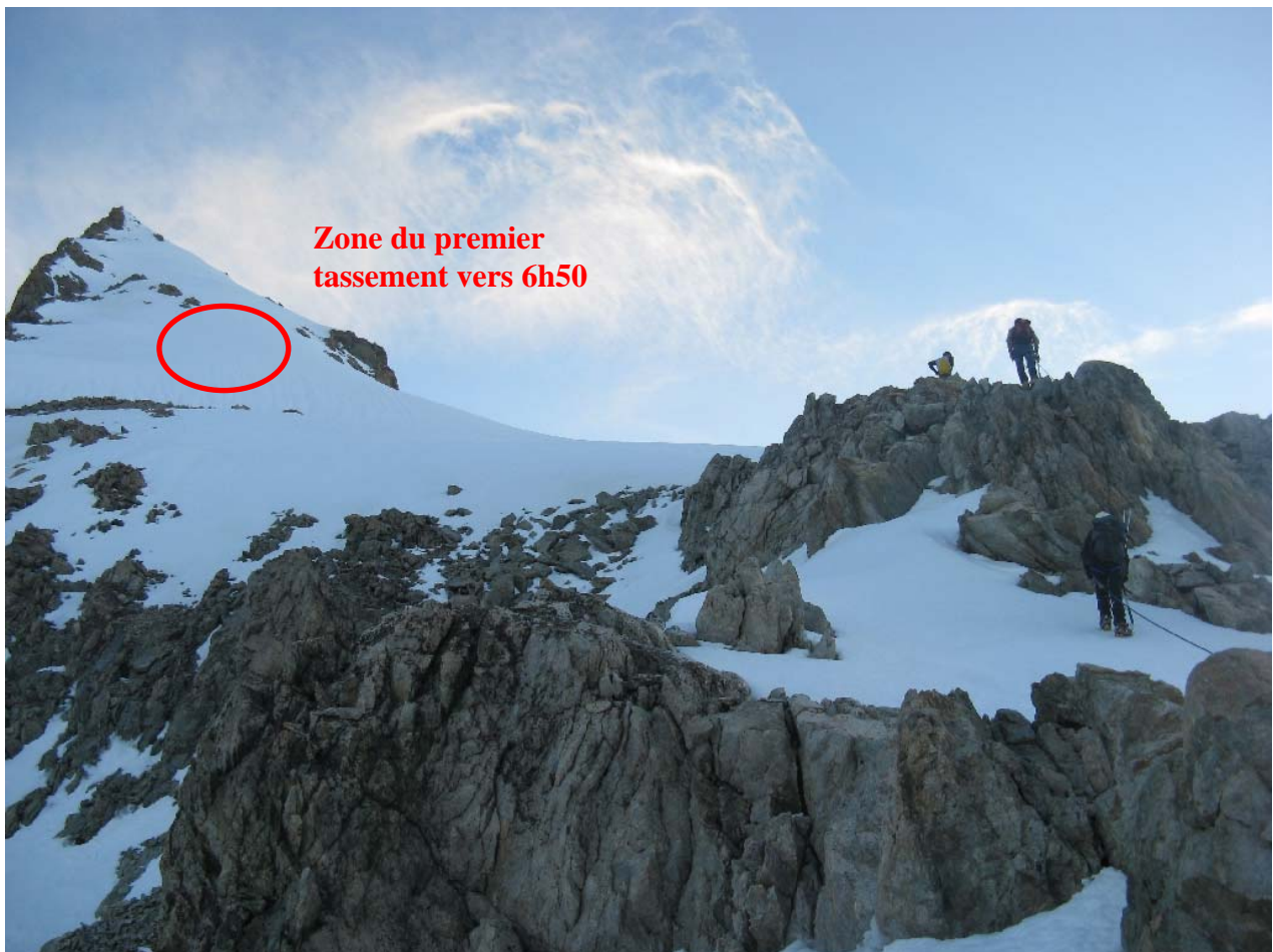
Figure 1 : Vue des pentes sous le point 3588 m, en sortant de l'arête mixte.

bloc et du premier relais, je discute une minute avec le gars qui remet l'anneau de corde « je l'avais enlevé car je croyais que c'était mon frère qui l'avait mis » me dit-il, on rigole, et il repart. On prend pied sur la brèche, la cordée des 2 frères continue, Nico passe devant. On fait une pose un peu au-dessus de l'arête mixte. La cordée des frères repart avant nous. Puis nous attaquons les premières pentes de neige menant au point 3588. Le temps commence à se couvrir, brumes liées au lever de soleil à l'est, gros cumulus sombres à l'ouest. Le temps s'assombrit très rapidement. Plusieurs cordées débouchent de l'arête derrière nous, et remontent maintenant les pentes de neige. Une autre cordée nous double, puis une fille seule monte à la même vitesse que nous : à 6h50 environ, vers 3450 m d'altitude, on sent et on entend un gros « broumf », avec un sérieux tassement qui se ressent dans les jambes. La fille qui monte seule, et qui est à notre hauteur, l'a également ressentie. La cordée qui est devant nous semble trop haut pour avoir ressentie quelque chose, quand à celle des 2 frères, elle doit déjà être sur l'arête effilée. Derrière nous, je ne sais pas s'ils ont ressenti quelque chose. On monte tous se mettre « à l'abri » un peu plus haut sur un affleurement rocheux. La fille seule reste au niveau de l'affleurement rocheux. Christine est fatiguée, et on poursuit, sans réelle prise de décision commune par rapport au « broumf », qui moi, m'inquiète un peu.